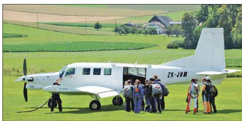
Mit Sack und Pack: Die Fallschirmspringer machen sich auf den Weg.

Für eine Premiere der besonderen Art sorgt gegen Abend der Massen-Ballonstart mit Heissluft-Ballons aus der Region. Ein farbenfrohes Spektakel, das für die Flüügerchilbi allerdings noch lange nicht den Schlusspunkt bedeutet.