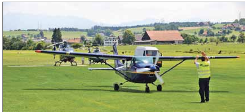
Viel Volk und Hochbetrieb auch auf dem Flugfeld in Beromünster.