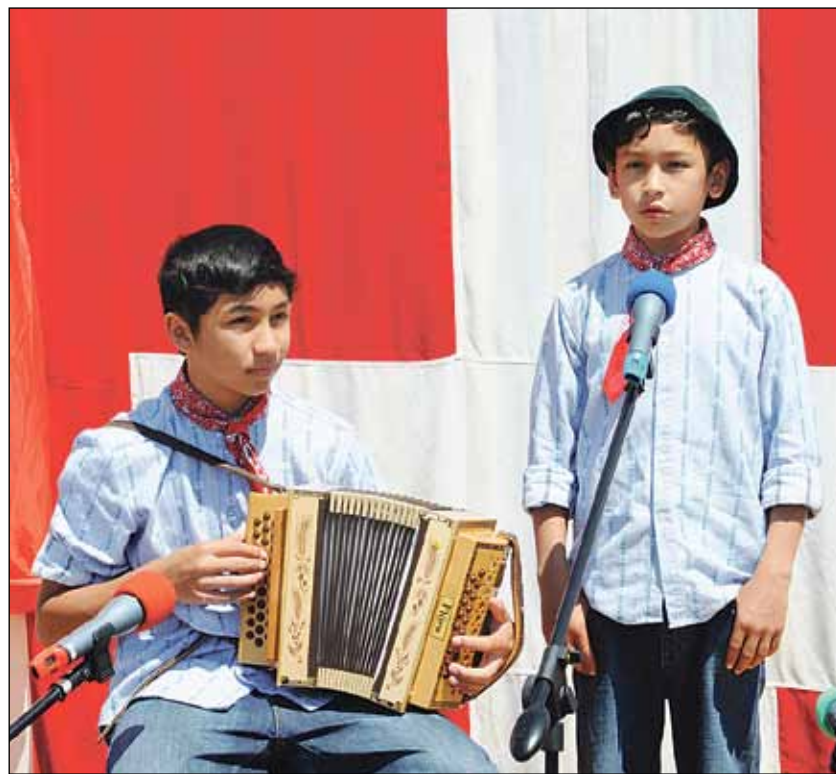
«Hopp de Bäse»: Die beiden Volksmusikstars Florian & Seppli trafen an der Flüügerchilbi in Beromünster auf eine grosse Fangemeinde.

Beromünster-Neudorf: Die «Flüügerchilbi» lockte das Volk in Scharen auf den Flugplatz Beromünster