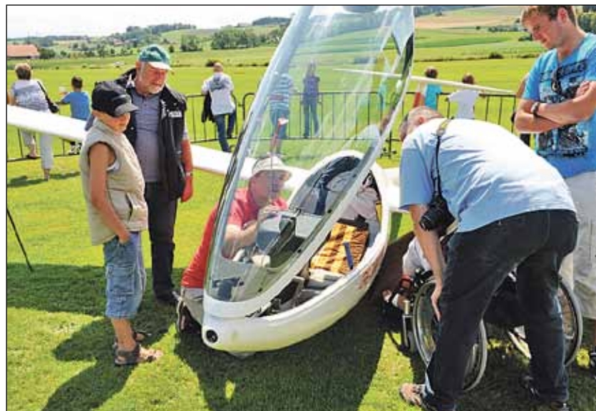
Faszination Cockpit: Viele Flug-Enthusiasten liessen sich das Segelflugzeug erklären.