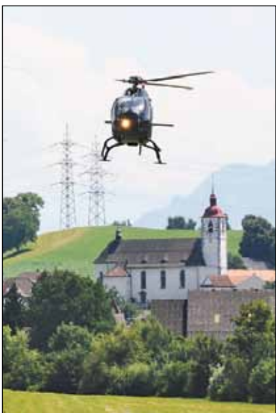
Heli-Anflug über Neudorf.