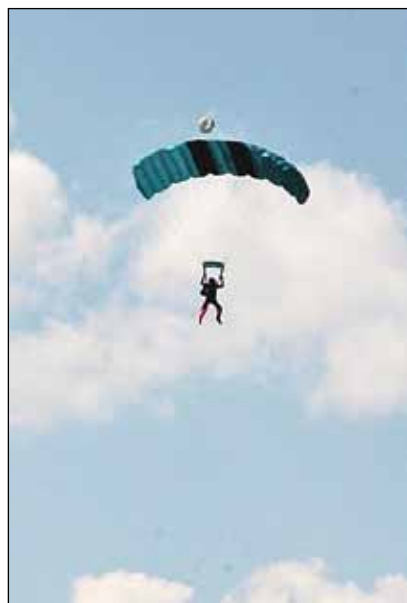
Sprung aus den Wolken: Menschliche Figuren am beinahe wolkenlosen Himmel.