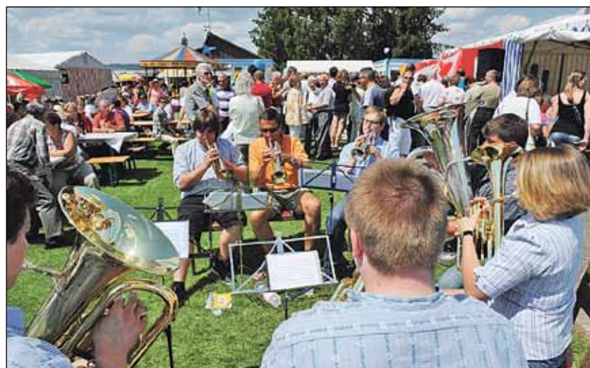
Das «Sextett Grausam» musizierte mit den Jodlern um die Wette.