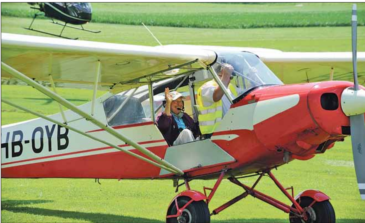
«Winke, winke»: Vom besonderen Abenteuer eines Rundflugs liess sich so mancher Besucher anstecken.